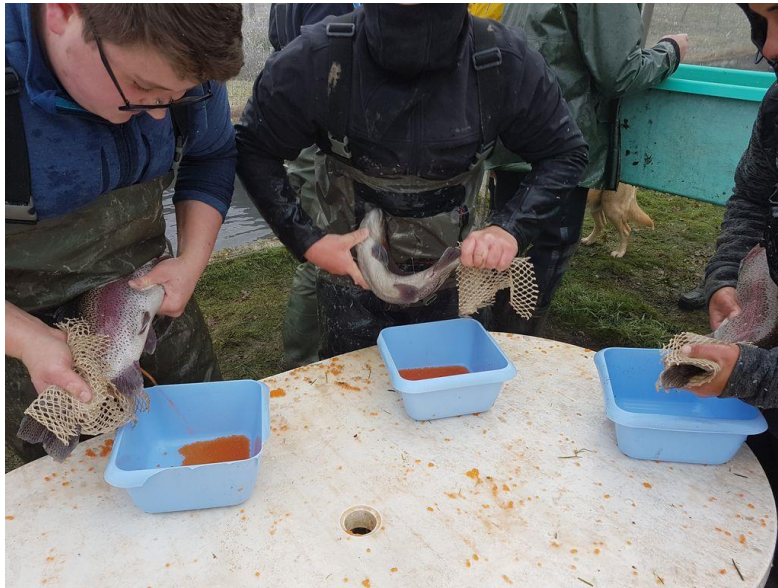
Collecte d'ovocytes de truite