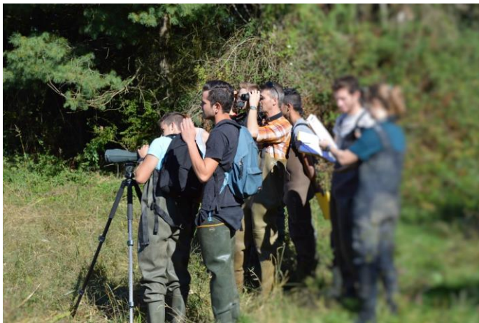
Analyse de l'environnement aquacole