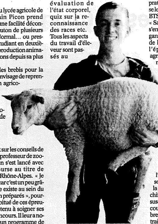
■ Romain Picon a été élu meilleur jeune berger de Rhône-Alpes.

coin. Et les résultats sont là. Lors de cette compétition très disputée les jeunes se sont soumis à des épreuves théoriques et pratiques : évaluation de l'état d'engraissement des agneaux, choix d'un bélier, parage des onglons, tri des brebis, évaluation de l'état corporel, quiz sur la reconnaissance des races etc. Tous les aspects du travail d'éleveur sont passés au